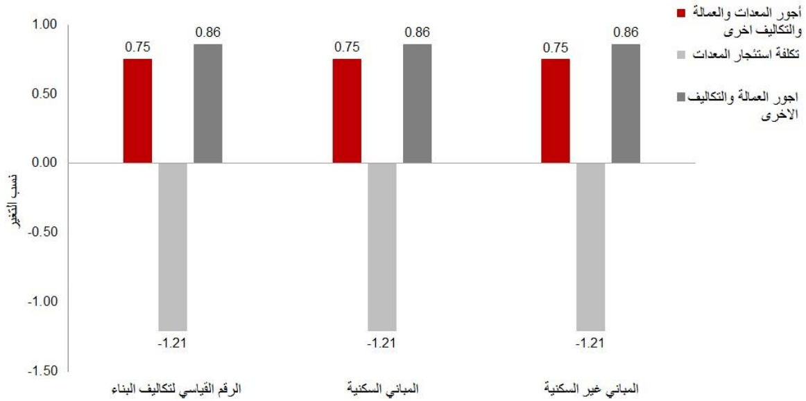
شكل (3) | نسب التغير في الارقام القياسية لأجور المعدات والعمالة والتكاليف الأخرى - النصف الأول 2015

ارتفع مؤشر أجور المعدات والعمالة والتكاليف الأخرى بنسبة 0.75%، نتيجة لارتفاع اجور العمالة والتكاليف الأخرى بنسبة 0.86%، على الرغم من انخفاض تكلفة استئجار المعدات بنسبة 1.21%. والجدير بالذكر إن التغيير في المؤشر حقق ارتفاعا متساوا للمباني السكنية وللمباني غير السكنية وبلغت نسبته 0.75%. ويوضح شكل (3) نسب التغير في الأرقام القياسية لأجور المعدات والعمالة والتكاليف الأخرى - النصف الأول 2015.