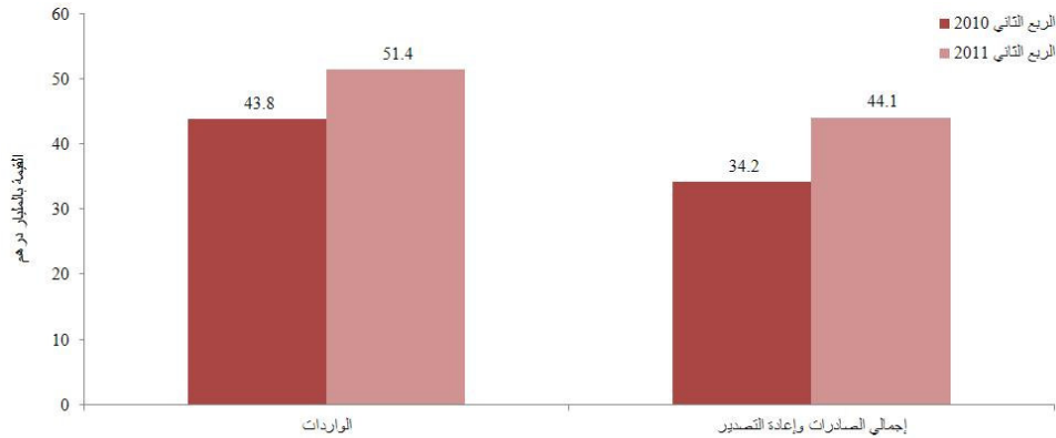
شكل (2) | تجارة المناطق الحرة والمستودعات الجمركية للربع الثاني 2010 - 2011